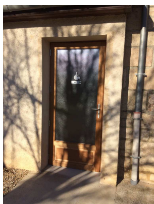
Porte d'entrée extérieure des WC