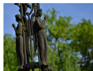
Croix Saint-Pierre sur la VC 1