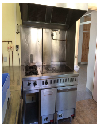
Nouvelle gazinière et hotte

La Commune a obtenu des subventions de l'Etat et du Département pour la réalisation de ces travaux.