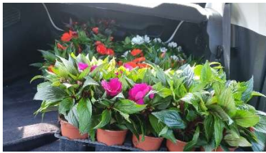
Fleurs offertes lors des aubades

Nous profitons de ce bulletin municipal pour lancer un appel aux bénévoles afin de venir renforcer l'équipe actuelle pour l'organisation des prochaines fêtes. En effet, les événements que nos associations organisent sont là pour fédérer les Albiacois à travers des moments conviviaux.