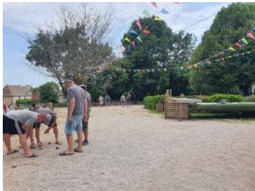
Les équipes en place pour le concours de pétanque